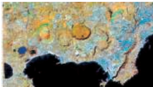
NAPOLI Il capoluogo campano visto dal satellite come appare su Google maps

L'antico sogno di vedere il mondo dall'alto, si è avverato. Cambiando anche i progetti degli urbanisti