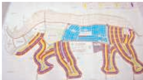
SUDAN Juba, città progettata a forma di rinoceronte nella regione meridionale del Sudan